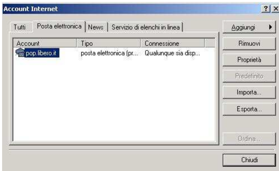
Figura 2: settings