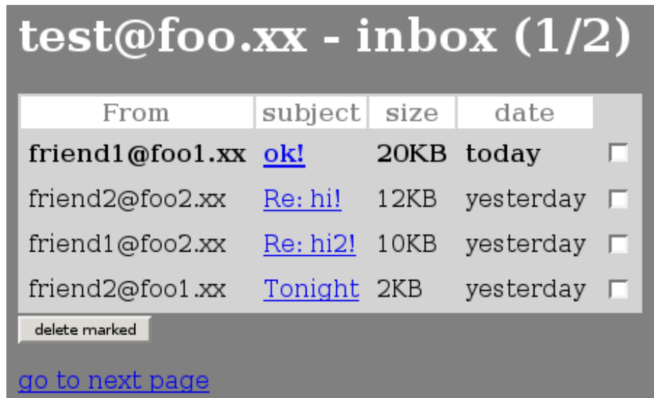
Figura 7: inbox

<input type="hidden" name="session_id" value="ABCD1234"> <table> <tr><th>From</th><th>subject</th><th>size</th><th>date</th></tr> <tr> <td><b>friend1@foo1.xx</b></td> <td><b><a href="/read.php?session_id=ABCD1234&uidl=123">ok!</a></b></td> <td><b>20KB</b></td> <td><b>today</b></td> <td><input type="checkbox" name="check_123"></td> </tr> <tr> <td>friend2@foo2.xx</td> <td><a href="/read.php?session_id=ABCD1234&uidl=124">Re: hi!</a></td> <td>12KB</td> <td>yesterday</td> <td><input type="checkbox" name="check_124"></td> </tr> </table> <input type="submit" value="delete marked"> </form> <a href="/inbox.php?session_id=ABCD1234&page=2">go to next page</a> </body>