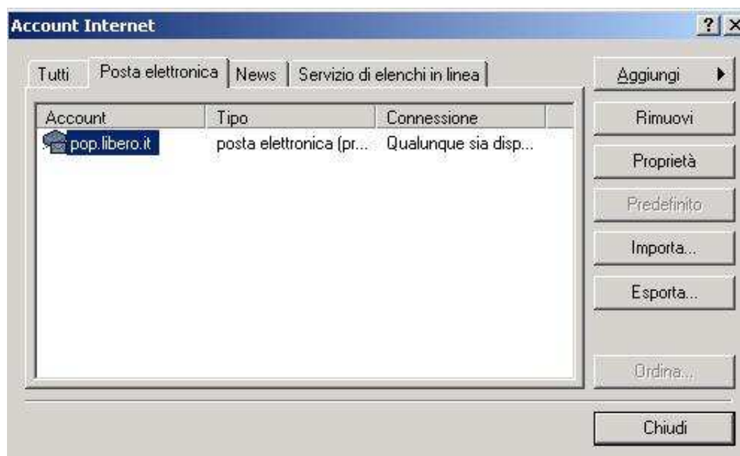
Figura 2: settings