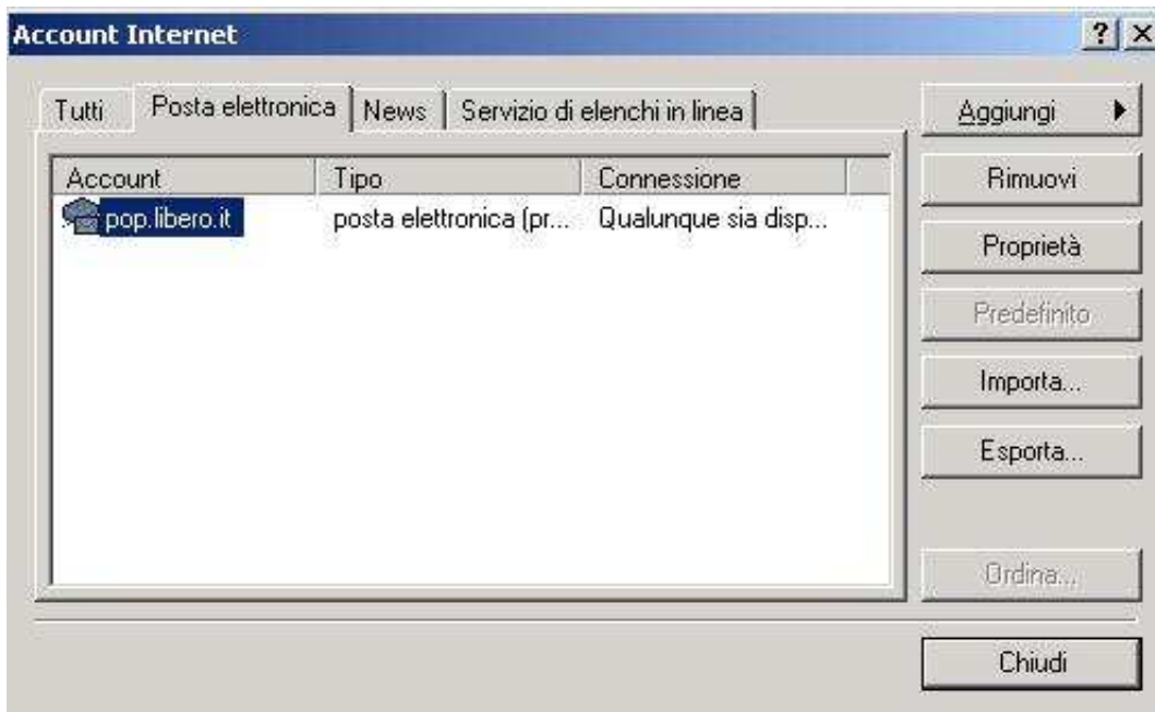
Figura 2: settings