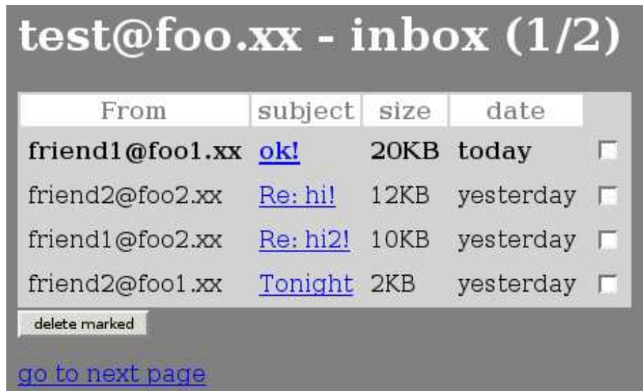
Figura 7: inbox

<input type="hidden" name="session_id" value="ABCD1234"> <table> <tr><th>From</th><th>subject</th><th>size</th><th>date</th></tr> <tr> <td><b>friend1@foo1.xx</b></td> <td><b><a href="/read.php?session_id=ABCD1234&uidl=123">ok!</a></b></td> <td><b>20KB</b></td> <td><b>today</b></td> <td><input type="checkbox" name="check_123"></td> </tr> <tr> <td>friend2@foo2.xx</td> <td><a href="/read.php?session_id=ABCD1234&uidl=124">Re: hi!</a></td> <td>12KB</td> <td>yesterday</td> <td><input type="checkbox" name="check_124"></td> </tr> </table> <input type="submit" value="delete marked"> </form> <a href="/inbox.php?session_id=ABCD1234&page=2">go to next page</a> </body>