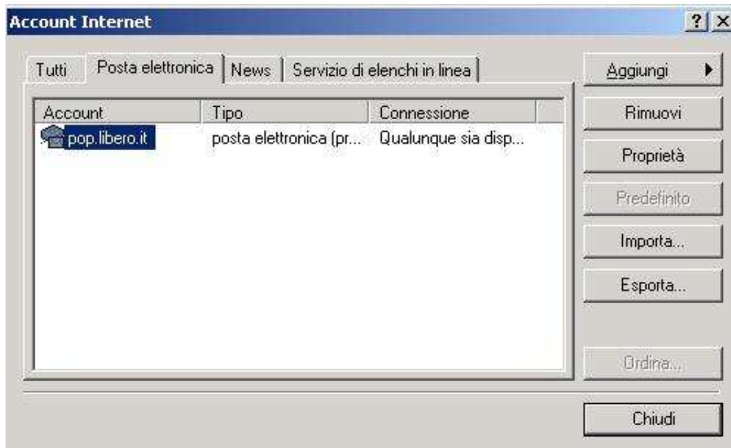
Figura 2: settings