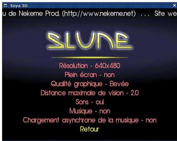
FIG. 1 – Options matérielles